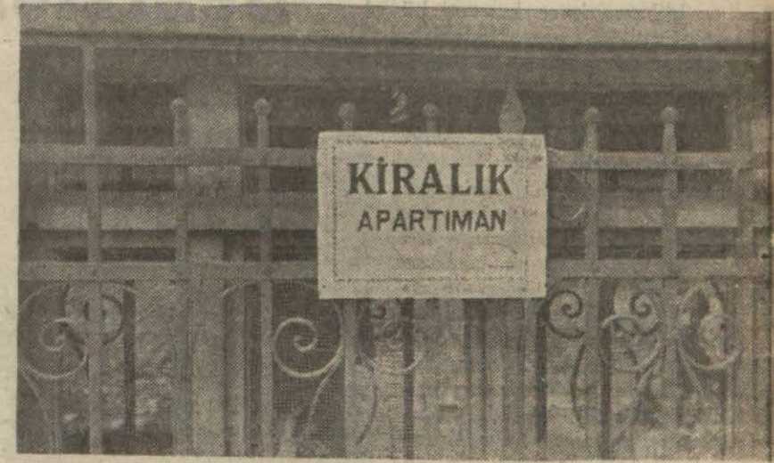
Kiralık bir apartımının kapısı

İrad sahiblerinin akla gelen her türlü kaçamak yollarına sed çekiliyor