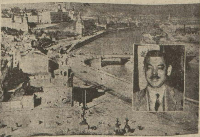
Moskovadan bir görünüş ve Japon Hariciye Naziri Matsuoka