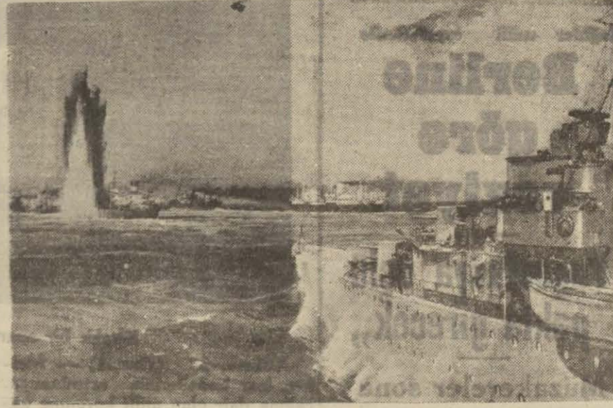
İngiliz ticaret gemilerine yapılan bir taarruzu gösterir tasvirî resim

Müdafaası ile mükellef bulunan gemileri kurtarmak için kendisini feda eden İngiliz kruvazörü Jervis Bay'ın macerası ve bu geminin süvarisi Edward Feganin büyük kahramanlığı deniz harbinin en şerefli sayfalarından birini teşkil edecektir.