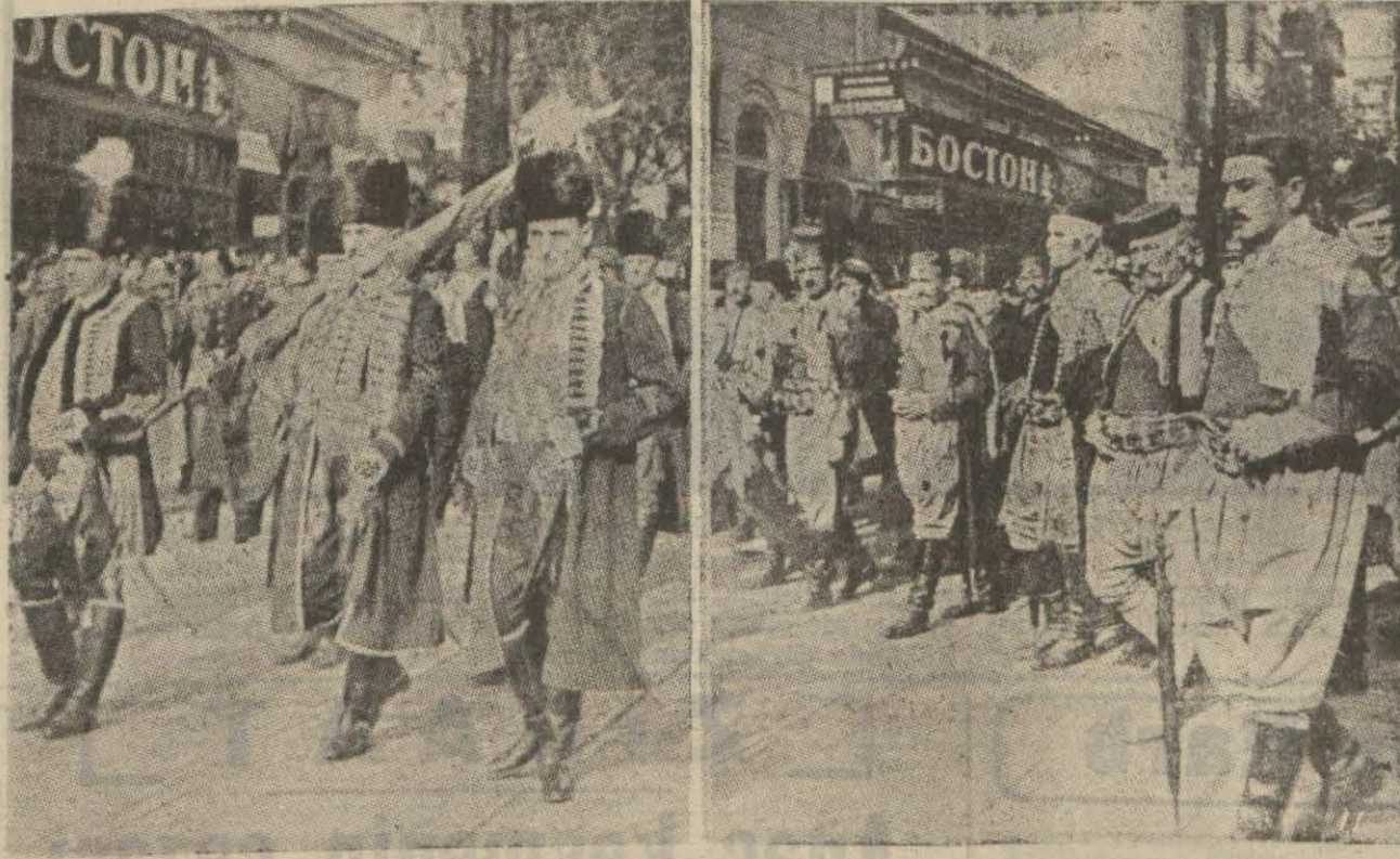
Yugoslavyayı teşkil eden unsurlardan üsisi: Daknaçayklar ve Karadağlılar millî kayafetleriyle