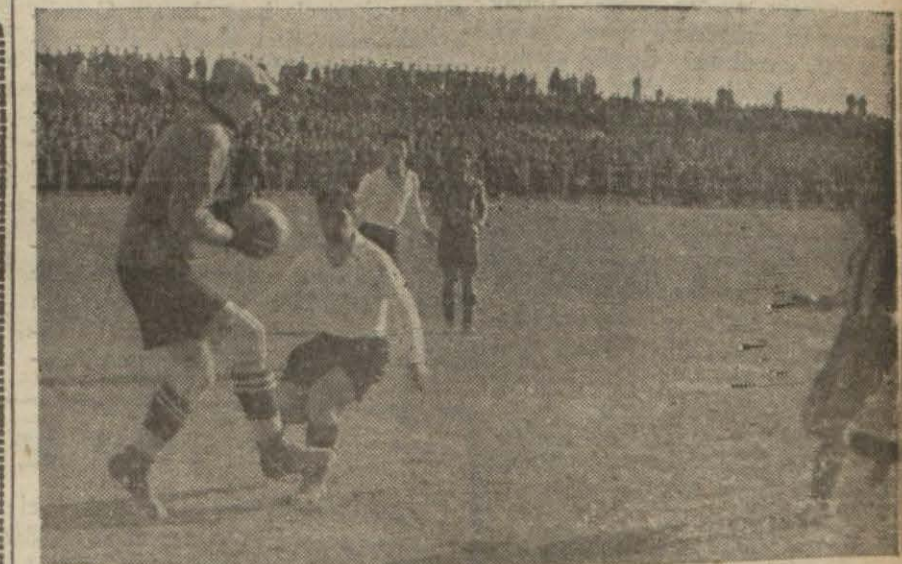
Beşiktaş - Fenerbahçe maçından heyecanlı bir sahfa

Dört klub arasında tertib edilen hususî maçların son oyunu dün Şeref sahasında yapılmıştır. Maçlarda büyük bir kalabalık bulunmuş ve Fenerbahçenin Beşiktaş'a mağlûb olması mevsimin büyük sürprizini teşkil etmiştir. G. Saray 4 - 1. Spor 2 Galatasaray müdafaasının bir - birini bozması dolayısıyla başlayan taşta mağlûb olması mevsimin büyük sürprizini teşkil etmiştir. (Devamı 7 nci sayfada)